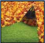
Rake your leaves

Be Prepared for the Upcoming Rainy Season!