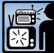
TV & Radio