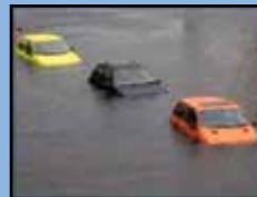
Mueva los vehículos