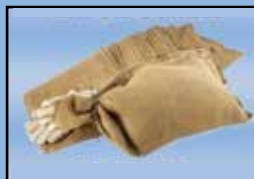
Bolsas de arena