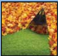
Barra las hojas

¡Hay estar preparado para la temporada de lluvias que se aproxima!