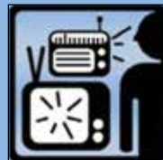
TV & Radio