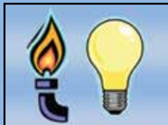
Apague los artefactos