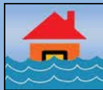
Seguro ante inundaciones