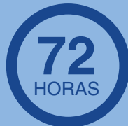
Kit para emergencias